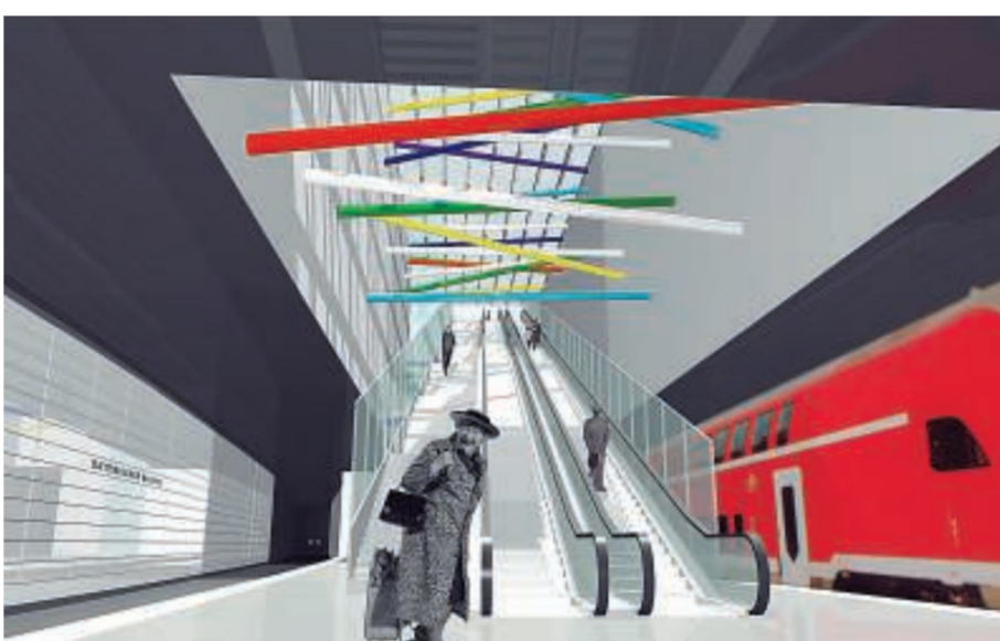
Eine der vier unterirdischen Stationen für den Leipziger City-Tunnel wird in den nächsten Jahren nach Entwürfen von Peter Kulka errichtet: Es ist die am Bayerischen Bahnhof.

te: Ein langer Gang in der Mitte und links und rechts Büros, das wird nicht in die rasante, vernetzte Welt der Zukunft passen. Architekten und Bauherren sollten die Verantwortung dafür übernehmen, dass sich in neu entstehenden Gebäuden neue Arbeitswelten entfalten können, die intelligenter sind als die bisher etablierten.